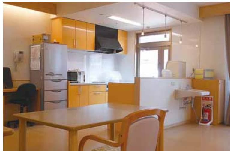
ユニット(キッチン・食堂)