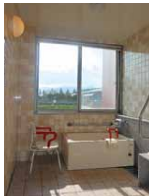
ユニット浴室(個浴)