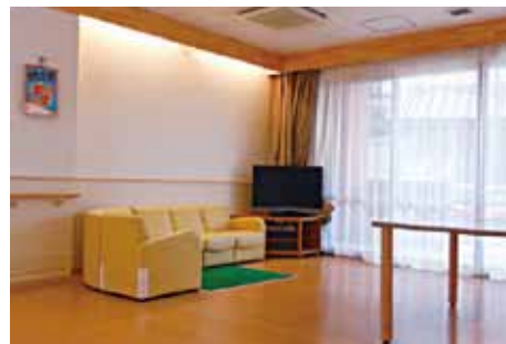
ユニット(共同生活室)